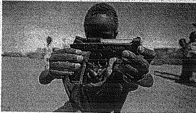
TRAGEDIA Un bambino sudanese con una pistola giocattolo made in China: molte delle armi utilizzate in Darfur sono prodotte a Pechino

«C aro presidente Hu, faccia qualcosa per risolvere pacificamente la situazione in Darfur». Dopo il boicottaggio di Steven Spielberg, che martedì ha lasciato l'incarico di consulente artistico dell'Olimpiade di Pechino per l'atteggiamento cinese nei confronti del Darfur (il governo di Pechino ha ribattuto parlando di scelta determinata da «secondi fini»), la nuova mossa contro la guerra civile che sta devastando il Sudan occidentale dal 2003 (200mila morti, 2,5 milioni di sfollati) porta la firma di 80 nomi famosi. Che ieri, sulla prima pagina del quotidiano Independent , hanno sottoscritto una lettera per il presidente Hu Jintao, numero uno del Paese