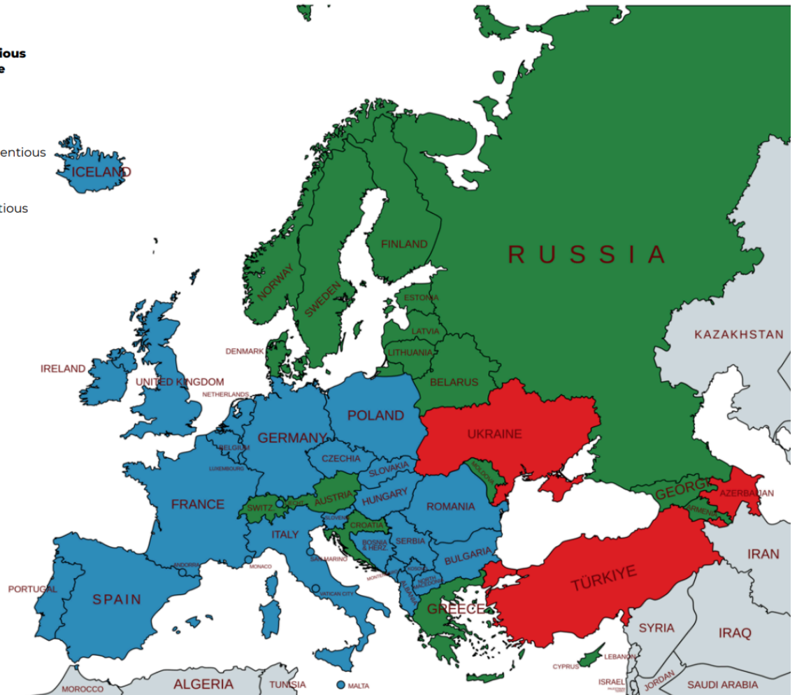
Fig.1 Mappa degli Obiettori di coscienza