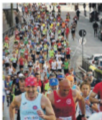
IN MARCIA I podisti in gara

In occasione della manifestazione podistica sono state disposte limitazioni al traffico e alla sosta, con divieti di fermata e transito, e verranno effettuate anche alcune variazioni di percorso della linea bus, specificate sul sito di Amstab. Tutte le informazioni disponibili su https://www.vivicitta.ru/v