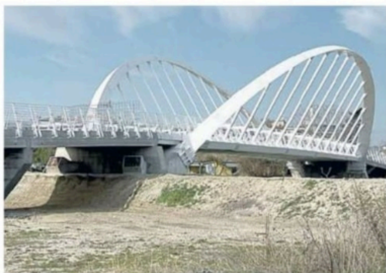
Il ponte ciclopedonale tra Porto San Giorgio e Marina Palmense