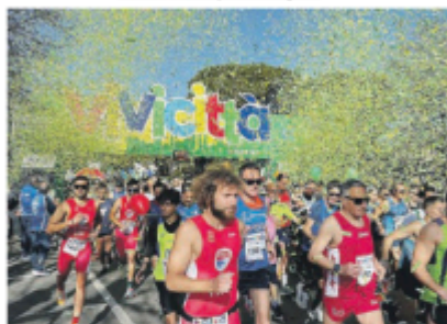
LA CORSA Una delle passate edizioni di Vivicittà