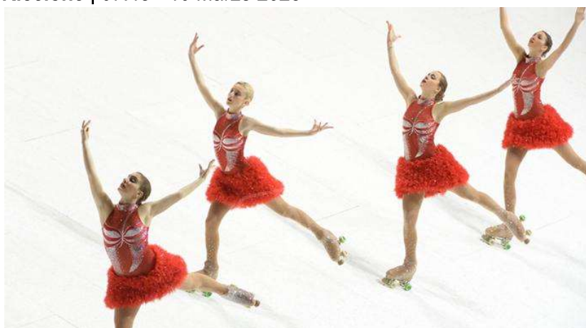
Immagine di repertorio.

Riccione torna ad essere protagonista del pattinaggio artistico con i Campionati Regionali UISP, che si terranno sabato 11 e domenica 12 presso il Pattinodromo di Viale Carpi.