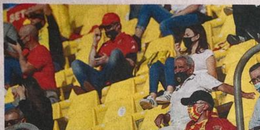
In mille Tifosi del Benevento allo stadio in occasione dell'incontro con l'Inter

Il fatto è che quando si parla di calcio (e di sport) in generale al tempo del Covid, spunta spesso, in particolare nei