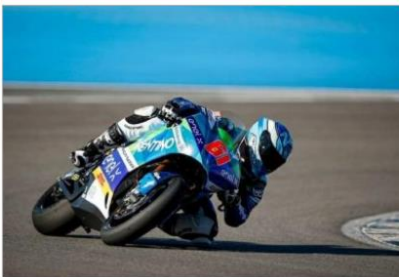
Zaccone a bordo del mezzo elettrico sul tracciato di Misano