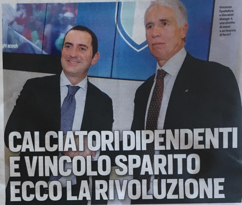
Vincenzo Spadafora e Giovanni Malagò: è una stretta di mano o un braccio di ferro?

Oggi riunione informale tra Malagò e i 44 presidenti di Federazione