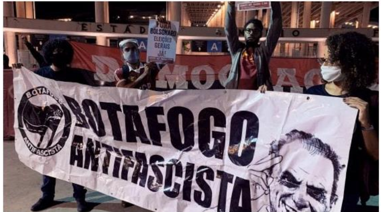
Tifoso del Botafogo protestano contro il presidente brasiliano Bolsonaro

Il torneo carioca è ripartito tra le polemiche (la pandemia sta mettendo a dura prova tutto il Sudamerica), ma rischia già di fermarsi di nuovo. Il primo cittadino Marcelo Crivella accoglie la richiesta dei due club di non scendere in campo: "I loro match rimangono in sospeso, ora il calendario va rimodulato"