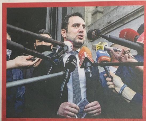
Ministro Vincenzo Spadafora, 46 anni, titolare del dicastero dello Sport del governo Conte