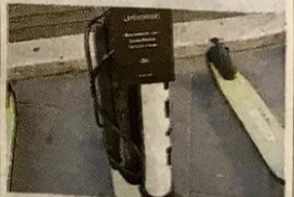
▲ Promozione Tariffa mensile