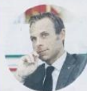
Mornati (48) segretario generale del Coni ANSA

ROMA - «Lo sport in Italia si fa solo attraverso le Associazioni sportive dilettantistiche e le Società sportive dilettantistiche, che si fondano sul volontariato. Bisogna sostenerle in ogni modo, perché se si chiudono le associazioni dilettantistiche finisce lo sport in Italia». Lo dice il segretario generale del Coni Carlo Mornati, riferendo in una audizione informale alle Commissioni riunite della Camera dei Deputati in merito alla legge del decreto liquidità. Il blocco delle attività a causa del Coronavirus «ha messo a dura prova l'attività delle Federazioni, delle Dsa e degli Enti, di promozione sportiva. Pur sostenendo l'azione del governo, il Coni auspica che possano essere poste in essere nuove azioni di rilancio dello sport dilettantistico». Aggiunge Mornati: «Sono state approntate misure di sostegno importanti e da apprezzare ma considerate le 120 mila società dilettantistiche, sarebbe importante che la capienza in futuro possa essere incrementata».