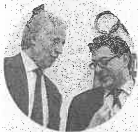
Malagò e Giorgetti

● (v.p.) «L'età anagrafica sta perdendo significato, è l'età biologica che conta. Cioè la capacità funzionale». Lo stato di forma, si direbbe nel linguaggio sportivo, dell'individuo. Il presidente Maurizio Casasco ha aperto ieri il congresso della Federazione Medico-Sportiva. Con lui c'erano anche i ministri Bussetti e Grillo (che si è poi dichiarata grande appassionata di nuoto davanti a Greg Paltrinieri, l'ospite a sorpresa della giornata) e il presidente del Coni Malagò, pronto per la visita della commissione Cio ai siti di Milano-Cortina che scatterà il primo aprile: «Siamo al rush finale, sono ottimista». La stessa parola usata dal sottosegretario Giorgetti. Viene confermata la linea governativa: ok alle spese per la sicurezza dei Giochi, ma anche a un contributo per opere olimpiche che possano diventare, a fine Giochi, patrimonio per i cittadini. Quanto alle nomine per Sport e Salute, il sottosegretario Valente chiede scelte di «discontinuità». Giorgetti promette una scelta «per la fine del mese».