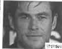
Ecco gli attori più alti: arrivano quasi a 2 metri (ALFEMMINILE)