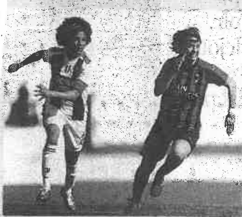
Sfida. Una fase dell'ultimo Juve-Milan.

« E che i calciatori maschi imparino dalle calciatrici femmine: le donne, in generale, sono più gentili e più educate degli uomini, si comportano meglio» ha ammaliato l'auditorio monsignor Gianni Infantino con l'ennesimo paragone che, per una volta, non scontenta l'altra metà del cielo. Certo adesso vai a spiegare a Nainggolan, Immobile, De Rossi, Chiellini e Insigne — a gente di personalità, insomma — che dovrebbero andare a lezione di bon ton dalla centravanti del Milan, dalla bomber della Juventus Women o dalla portiera della Fiorentina. Ma il presidente della Fifa non ha dubbi: il modello di comportamento — pur trattandosi di due facce del pallone con raggio di diffusione, audience e livello di