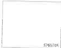
Alto Adige Balance: la pausa perfetta di primavera (SUDTIROL)