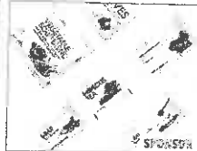
Ecco perché dovresti digiunare per 5 giorni con il programma (PROLON)