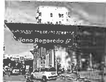
«Fuori dal bosco», a Rogoredo il dibattito sulle strategie antidroga