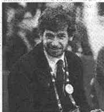
Demetrio Albertini, 48 anni