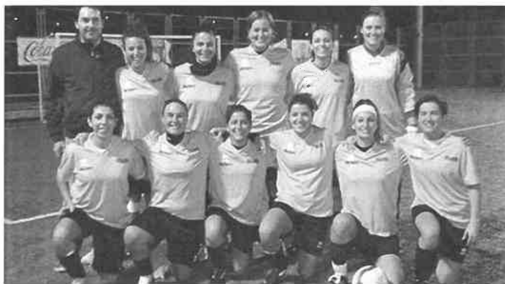
Il Boglia United

Condividi Facebook Twitter Google+ Print WhatsApp Email