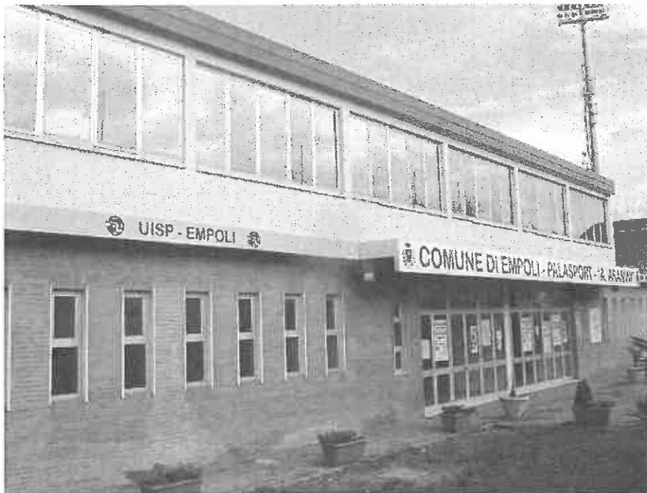
Il PalAramini di Empoli

Natale è alle porte, è il momento di rendere speciali le vacanze. La Uisp Empolese Valdelsa anche quest'anno propone i Centri Sportivi Invernali rivolti ai bambini di età compresa tra i 6 e gli 11 anni. Dal 27 al 28 dicembre e dal 2 al 4 gennaio i nostri operatori saranno al Palasport Aramini di Empoli, pronti a far giocare e divertire i bambini.