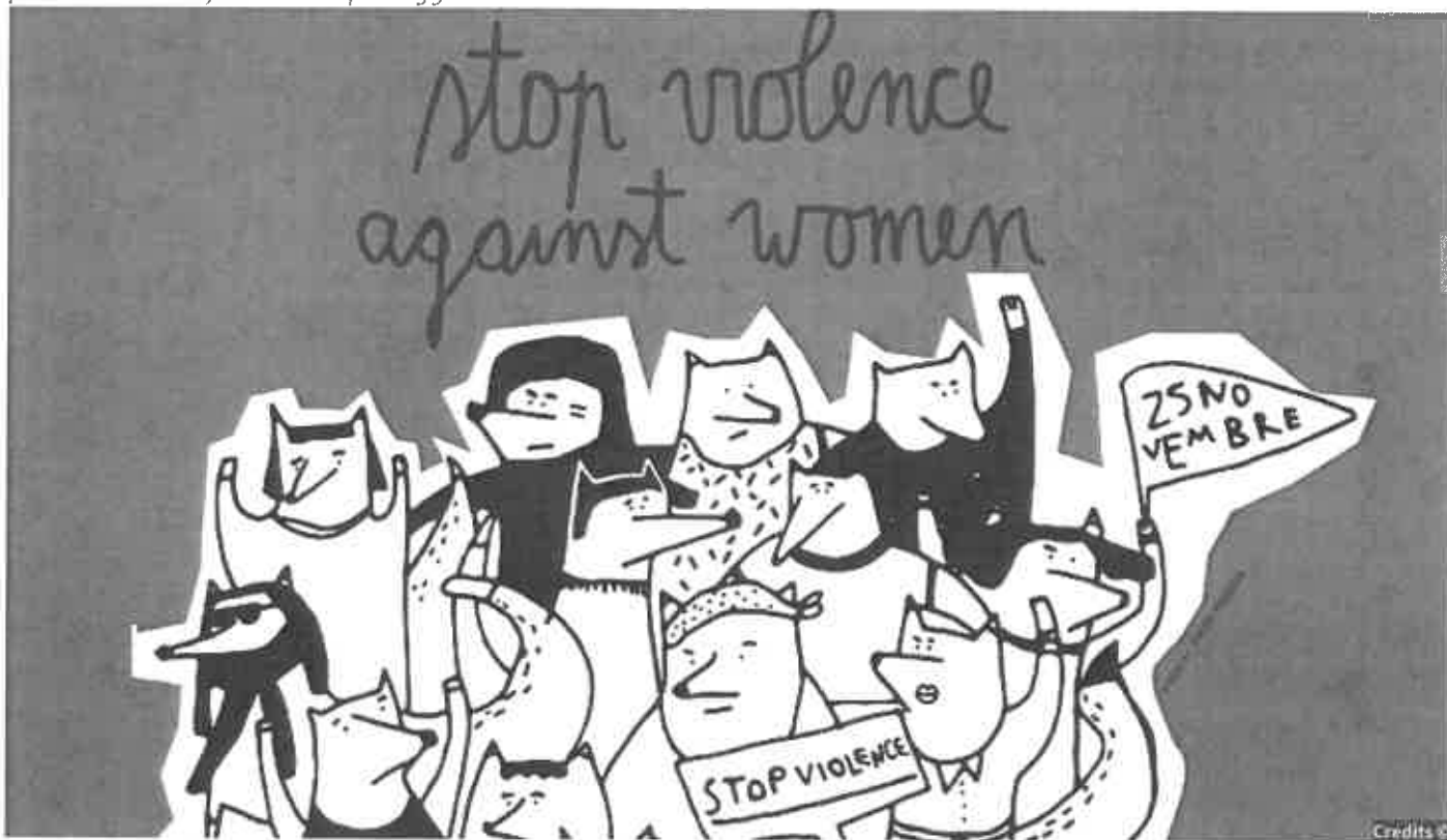
La locandina dell'evento

Settima edizione dell'iniziativa del Comune e della Rete dei servizi contro la violenza alle donne. Quest'anno un percorso diverso, tutto sulle passeggiate del Talvera