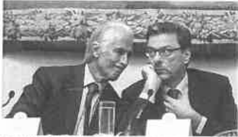
Giovanni Malagò, presidente Coni, con Giancarlo Giorgetti, sottosegretario alla Presidenza del Consiglio

"Non chiamiamola riforma, questa è l'occupazione del Comitato Olimpico. Vogliono trasformarci in un tour operator". Non usa mezzi termini, Giovanni Malagò. Il presidente del Coni trasforma il suo intervento in apertura del Consiglio nazionale straordinario convocato per discutere della proposta di legge del governo, in un'arringa che è insieme di difesa e attacco. "Il Coni è senza dubbio il comitato olimpico oggi più prestigioso al mondo, con la riforma del governo diventerebbe senza dubbio l'ultimo". Malagò giura di non voler fare polemica e di voler essere "costruttivo", ma affonda i colpi: "Il governo ha un'idea sbagliata e profondamente ingiusta - dice -. Che non rispetta la grande storia del Coni. Nemmeno sotto il fascismo ci si era spinti a tanto".