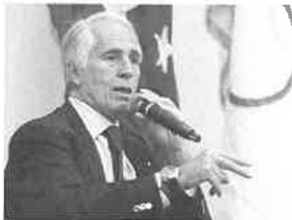
Giovanni Malagò

Dopo settimane di incontri e di colloqui, a quanto pare infruttuosi, il presidente del Coni Giovanni Malagò attacca il governo: «Questa non è la riforma dello sport italiano, non c'entra nulla. Questo è un discorso in modo elegante di occupazione del comitato olimpico italiano».