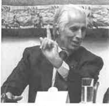
Giovanni Malagò

ROMA - Questa non è la riforma dello sport italiano, non c'entra nulla. Questo è un discorso in modo elegante di occupazione del Comitato olimpico italiano. Lo stesso fascismo, pur non essendo estremamente elastico nell'acconsentire a tutti di esprimere le proprie opinioni, aveva rispettato quella che era stata la storia del Coni dall'epoca della sua fondazione".