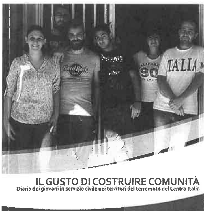
IL GUSTO DI COSTRUIRE COMUNITÀ Diario dei giovani in servizio civile nei territori del terremoto del Centro Italia

Un'opportunità per rialzarsi e reagire dopo una catastrofe violenta e devastante. Questo ha rappresentato per 1.298 ragazze e ragazzi, quasi tutti residenti nelle aree del terremoto del 2016, l'anno di servizio civile appena concluso. Per 218 di loro, il traguardo è stato celebrato ad Amatrice nei giorni scorsi, con la presentazione del libro “Il gusto di costruire comunità” (nell'immagine la copertina) che raccoglie testimonianze, emozioni e ricordi di un anno che resterà per sempre nella loro memoria.