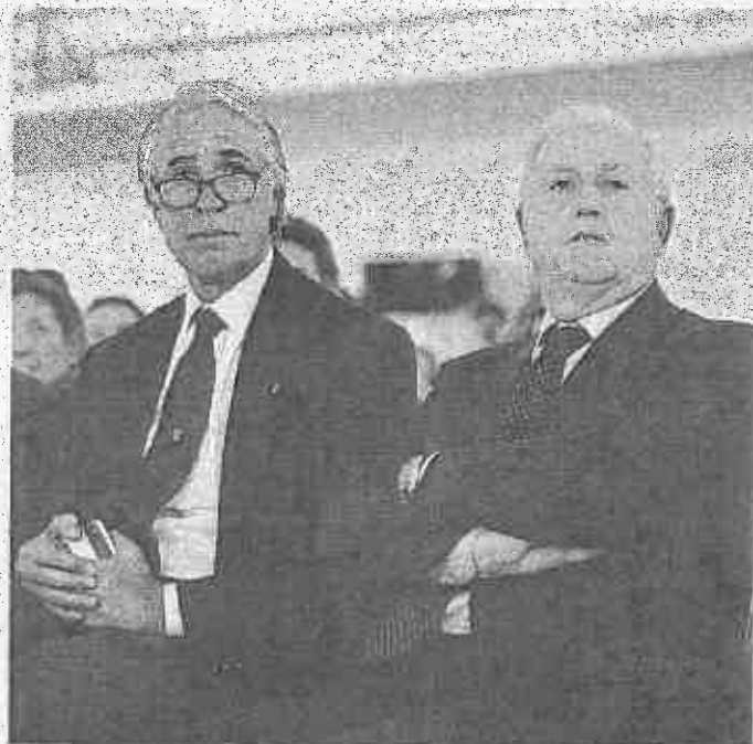
Il presidente Coni Malagò, 59 e il commissario Figc Fabbri, 72 ANSA

VIA LIBERA Ieri i «principi» sono passati con un solo voto contrario, quello del presidente della Federnuoto, Paolo Barelli (sul sì alla proroga del commissariamento si è aggiunta la naturale astensione dello stesso Fabbri), che ritiene le norme adottate contrarie alla legge: «Parlo da un punto di vista giuridico. È un'invasione di campo. E anche sul diritto di voto per arbitri e giudici a decidere deve essere l'assemblea federale». «È stato fatto un lungo lavoro preparatorio. Questa è una tua opinione personale, legittima, che però lascia il tempo che trova», ha risposto Malagò. Che nega la necessità di un tavolo della pace per svelenire il clima: «Con tutti gli interlocutori c'è un dialogo, ho sempre parlato con loro in un modo af-