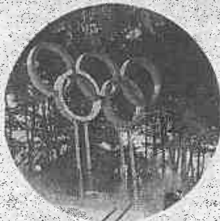
Giochi di PyeongChang 2018