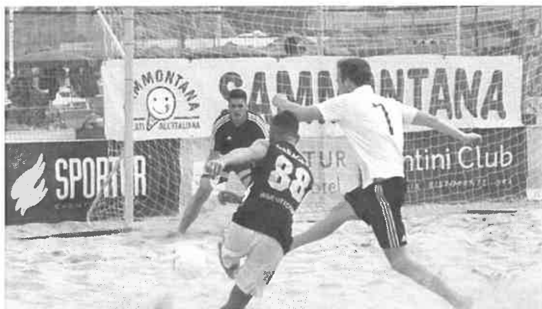
Sammontana Beach Soccer Cup

Ultimo aggiornamento: 10 luglio 2018 ore 16:22