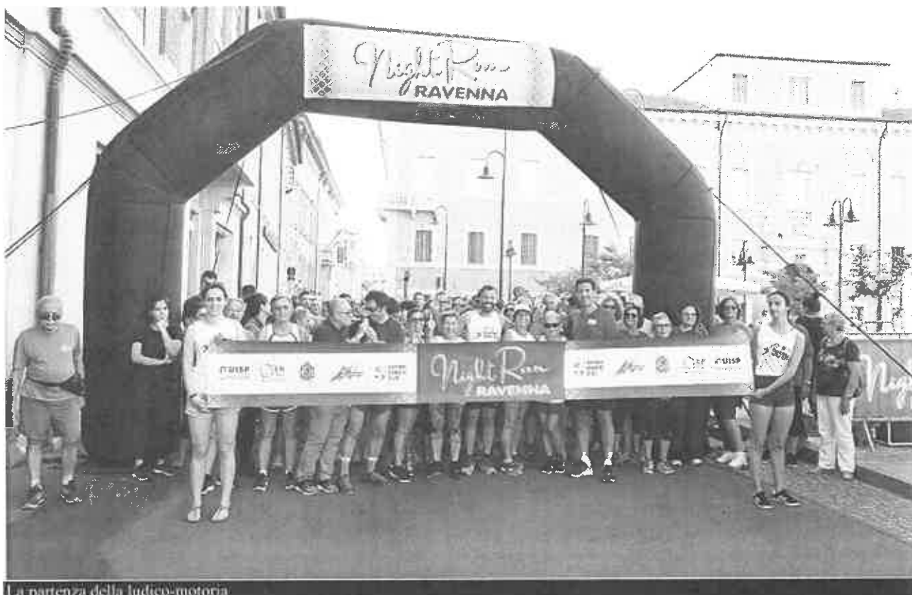
La partenza della ludico-motoria