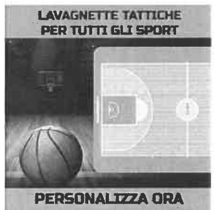
LAVAGNETTE TATTICHE PER TUTTI GLI SPORT