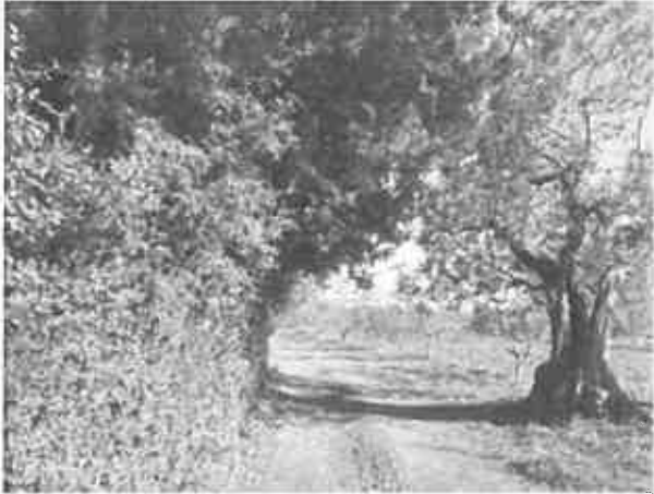
Percorso Bibbona Ecomarathon

ORARI E SUGGERIMENTI PER LA SICUREZZA. La gara si svolge in un ambiente bucolico, nel bellissimo paesaggio toscano, tra pinete, campi, borghi, pieno di luoghi suggestivi e ricchi di storia da rispettare e dove la sicurezza non deve essere trascurata. Il consiglio è sempre quello di avere piena coscienza che il bosco e l'ambiente vanno rispettati, che le condizioni meteo e il terreno non sono sempre uguali; quindi il consiglio è di indossare un paio di scarpe da trail, avere con sé un telefono cellulare, un telo termico, un cappellino o bandana per il capo ed eventualmente una giacca anti-pioggia. Ritrovo dalle ore 7:00 a Marina di Bibbona presso il campeggio "Le Esperidi".