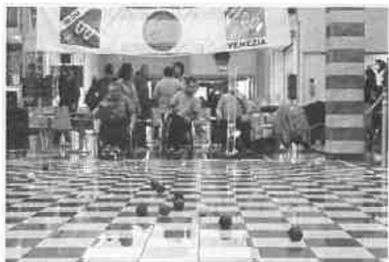
Un'immagine del torneo di boccia paralimpica tenutosi nel marzo scorso a San Donà di Piave (Venezia), durante una delle più recenti tappe di "Happy Hand in Tour"

Due giornate di sport, gioco, divertimento e buona informazione per tutti, persone con e senza disabilità, bambini, ragazzi e adulti, sono quelle in programma per domani, 5 maggio e domenica 6, a Conegliano (Treviso), da dove ripartirà "Happy Hand in Tour", il ciclo di eventi che anche in questa seconda edizione sta coinvolgendo migliaia di persone in tanti Centri Commerciali IGD di tutta Italia, continuando a diffondere con successo una nuova cultura sulla disabilità, sempre grazie all'impegno della Società IGD, della FISH, del CIP, dell'Associazione WTKG, del CSI e dell'UISP