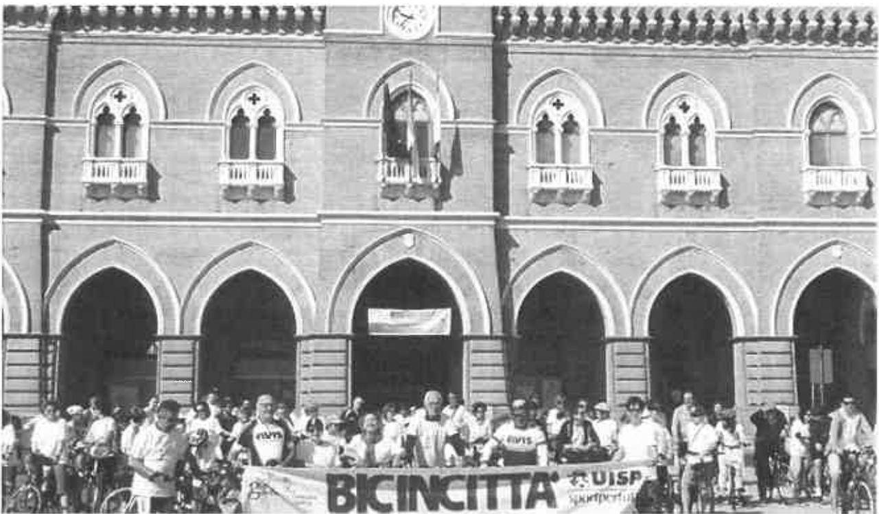
di una passata edizione

La decisione è stata presa dalla Pro Loco di Casalmaggiore di concerto con UISP organizzatrice dell'evento. La manifestazione era inizialmente in programma questa domenica