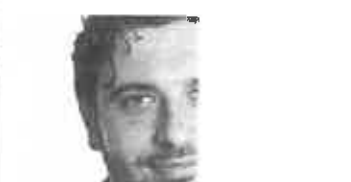
Fondi Por Fesr Mortaruolo: "In nuovi fondi per