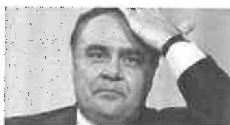
Crack finanziario da 100 milioni, Mastella tenta l'omicidio perfetto del...