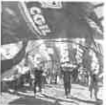
25 aprile, la Cgil: "Sia una