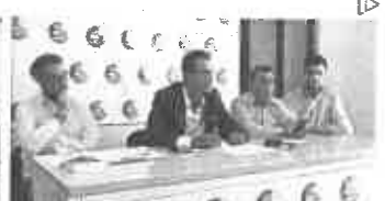
Caso Bello, il padre querela, la figlia chiede i soldi per danno...