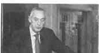
Assunzione a FS, De Caro: "Non ho segnalato la Bello