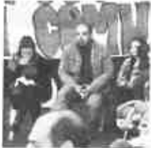
Atti vandalici Spina Verde,