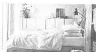
Camera da Letto IKEA