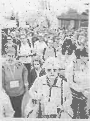
I bambini che hanno partecipato con i loro genitori. In alto: i bambini che hanno partecipato con i loro genitori. In basso: i bambini che hanno partecipato con i loro genitori.

La festa di quartiere è una festa di quartiere che si celebra in tutta la città. È la festa di quartiere che si celebra in tutta la città. È la festa di quartiere che si celebra in tutta la città.