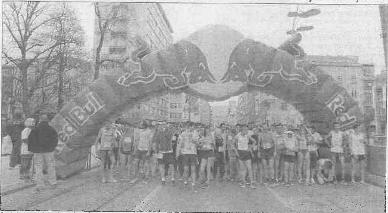
Brojni učesnici krenuli sa starta

VIVICITTA 2018 Više od 300 takmičara na međunarodnoj atletskoj utrci