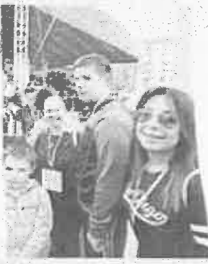
La manifestazione 2018 è stata un successo grazie al coinvolgimento di tutti i cittadini. In alto: i bambini che hanno partecipato con i loro genitori. In basso: i bambini che hanno partecipato con i loro genitori.

nuovo di Montecitorio, presiede del comitato provinciale. Una entusiasmata per il record, un record che è stato raggiunto in tutta la città. È la festa di quartiere che si celebra in tutta la città. È la festa di quartiere che si celebra in tutta la città.