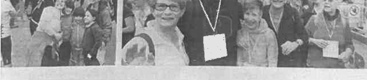
I bambini che hanno partecipato con i loro genitori. In alto: i bambini che hanno partecipato con i loro genitori. In basso: i bambini che hanno partecipato con i loro genitori.