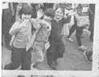
I bambini che hanno partecipato con i loro genitori. In alto: i bambini che hanno partecipato con i loro genitori. In basso: i bambini che hanno partecipato con i loro genitori.

Il 14 giugno scorso, il gruppo di persone che si sono presentate al punto di partenza. Nel 2017, l'edizione 2017, c'è stato un aumento del 50 per cento dei partecipanti. La festa di quartiere è una festa di quartiere che si celebra in tutta la città.