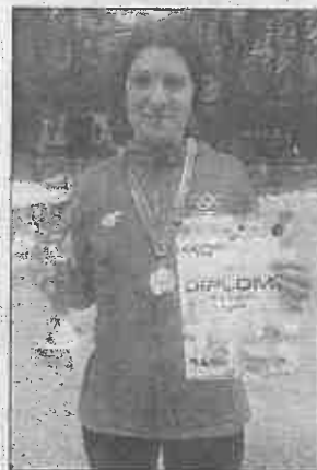
Subotić: Dolazim svake godine ražda, osvojivši po 100 KM.

Njima je uručeno po 200 KM, dok su trećeplasirani bili Hanifa Terzić iz Sarajeva i Alija Imamović iz Go-