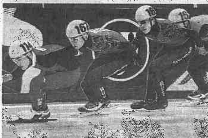
Viktor Ahn, il secondo da sinistra, 32 anni e sei ori olimpici