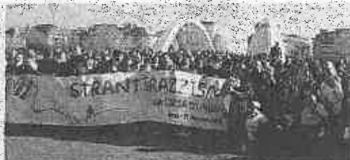
Ponte della Musica: ecco la Strantirazzismo MEFFE

● (g.u.l.g.) Nel bilancio della Corsa di Miguel, che domenica ha frantumato i suoi record, c'è anche la crescita della sua «sorellina», la Strantirazzismo. Come vuole la tradizione, la passeggiata-corsa sui 3 chilometri è partita dal Ponte della Musica ed è arrivata subito dopo la «Miguel» nello stadio Olimpico. In prima linea, tante scuole: la «Filosi» di Terracina è venuta con un pullman, stessa cosa per il «Pantaleoni» di Frascati. Ma c'erano anche tanti ragazzi del Taletè, i ragazzi che il sabato erano già