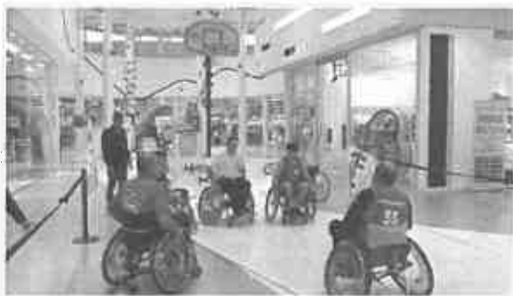
Una partita di basket in carrozzina, durante la precedente tappa romagnola di "Happy Hand in Tour", svoltasi a Faenza (Ravenna) il 4 e 5 novembre scorsi

Eccezionalmente programmata di venerdì e sabato, ovvero domani e dopodomani, 17 e 18 novembre, torna dopo due anni a Rimini "Happy Hand in Tour", il ciclo di eventi che ha già coinvolto decine di migliaia di persone in tanti Centri Commerciali IGD di tutta Italia. E sarà una vera esplosione di sport, creatività e divertimento, per questa nuova tappa della manifestazione, che sempre grazie ai tradizionali partner – la Società IGD, la FISH, il CIP e l'Associazione WTKG – cui si sono aggiunti il CSI e l'UISP, promuove tante iniziative, continuando a diffondere una nuova cultura sulla disabilità