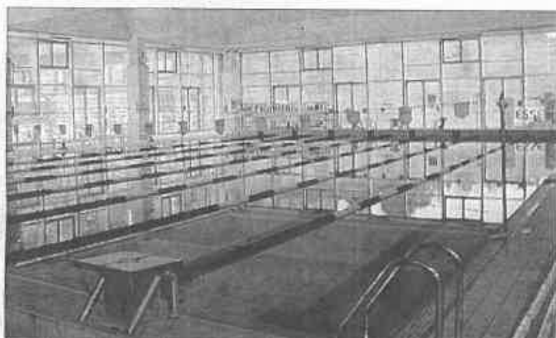
La piscina dell'Acqua Calda sarà gestita dalla Uisp come quella di piazza Amendola

Sentenza Il provvedimento del Tar dà ragione infatti alla Uisp e al Comune su tutta la linea. Secondo i giudici, infatti, è stata legittima l'esclusione dal bando di gara della Virtus per problematiche inerenti al piano economico finanziario o ai requisiti che, per legge, esso deve contenere. Il Pef è il piano economico relativo al project financing e secondo il Tar l'asseverazione, cioè la una dichiarazione con la quale la società di revisione attesta la coerenza e l'equilibrio del piano eco-