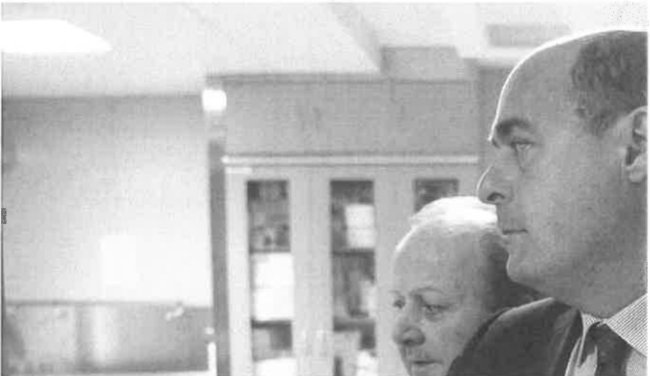
Impiantistica: convenzione Ics-Reg.Lazio

Ultimo aggiornamento: 8 novembre 2017 ore 18:50