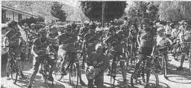
Ex corridori e amatori in tour per ricordare Paolo Borsellino

U na ciclo-staffetta itinerante, che ha attraversato l'Italia nel nome di Paolo Borsellino, per conservarne il ricordo e per riaffermarne l'impegno contro la mafia. La carovana in bicicletta è arrivata ieri a Palermo, proprio alla vigilia dell'anniversario dell'attentato, per l'ultima tappa. Partito da Bollate (Mi) il 25 giugno, il tour ha toccato Bologna, Grosseto, Roma, Napoli, Bari, Reggio Calabria e Messina. «L'Agenda ritrovata» è il progetto promosso dall'associazione l'Orablù, in collaborazione con Salvatore