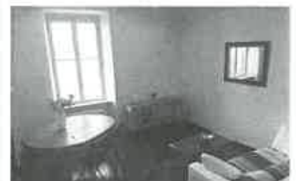
Bilocale, via orti della farnesina