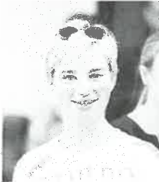
L'olimpionica Bebe Vio