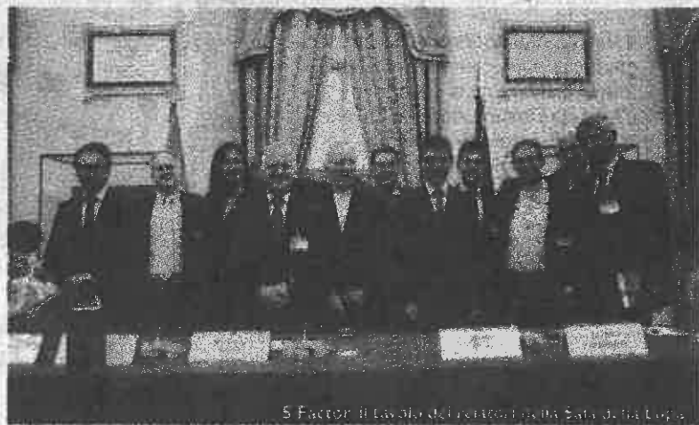
S Factor: il tavolo del centro Italia Bari della Logo

disagiate non possono accedere allo sport. L'attività del Centro Sportivo Italiano si fonda sugli oltre 135 mila dirigenti, tecnici e arbitri che, insieme a collaboratori e dipendenti formati e motivati, mettono il loro tempo a disposizione per garantire momenti di sport, di gioco e di relazione ai più giovani, un impegno che equivale a più di 10 milioni di ore di volontariato per un valore economico superiore ai 160 milioni di euro.