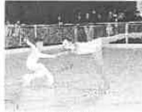
Una gara di pattinaggio

Sabato, dalle 14,30, obbligatori, che vedranno in gara Piccoli Azzurri debuttanti, Allievi Giovani, Allievi Giovani debuttanti, Juniores Giovani, Juniores Uisp, Professional Cadetti, Azzurri Giovani (m), Azzurri Giovani, Professional Jeunesse e Senior. Poi toccherà al libero di Allievi Giovani, Juniores Giovani, Juniores Uisp, Az-