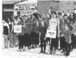
Una passata edizione di Giocagin

Tre le esibizioni della Gimnastica Grifone, due dell'Area 42 Roccastrada, dell'Artistica Grosseto e della Dance System; un'esibizione a testa per Cp Europa, Csn Porto Santo Stefano, Polvere di Magnesio, Argentario senza ostacoli, Polisportiva Barbanella Uno, Rianimazione Latina.