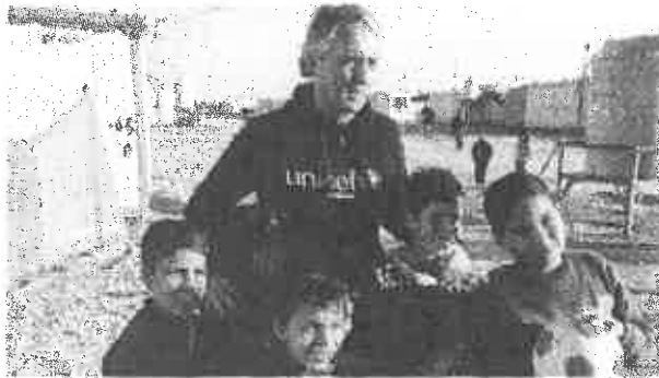
Roberto Mancini con alcuni bambini siriani rifugiati