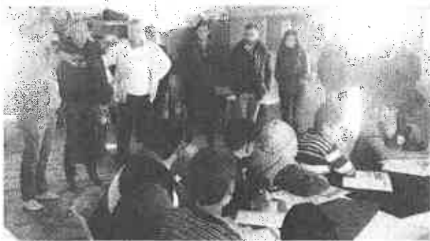
Il tecnico dell'Inter in visita alla scuola del campo