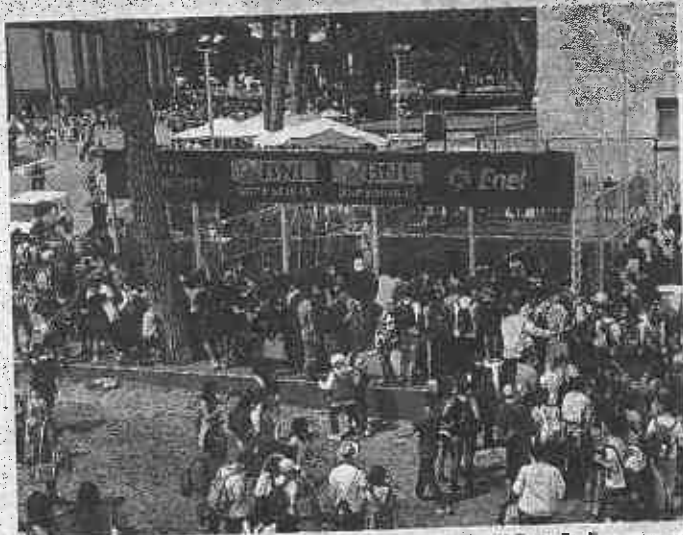
Un momento di un incontro di paddle lo scorso anno al Foro Italico TEDESCHI

IL PROGETTO Alcuni ragazzi affetti da disabilità della sezione di Roma dell'Associazione Italiana Persone Down saranno guidati dagli istruttori federali in un primo incontro con la giovane disciplina. Dalle ore 12 una lezione gli istruttori di Paddlemania spiegheranno ai ragazzi