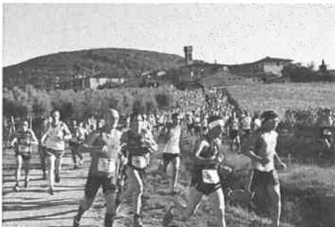
Eco-maratona del Chianti

14 ottobre 2015 19:50 · Attualità · Castelnuovo Berardenga