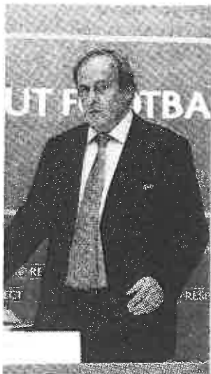
Il n° 1 Uefa Michel Platini