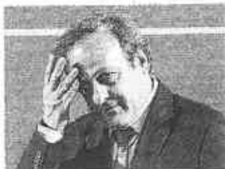
Sotto accusa Michel Platini