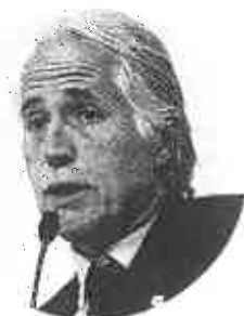
Il presidente del Coni Malagò