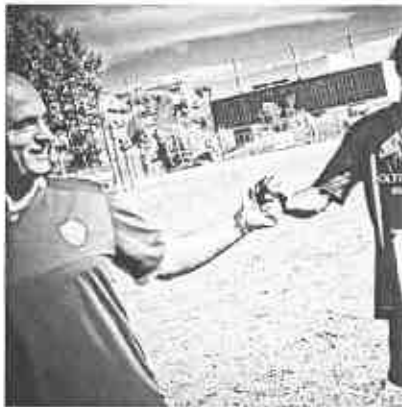
Roma Cares e Football Cares.

Il campo di Pasolini torna a brillare per ospitare i rifugiati politici di Liberi Nantes. La Roma scende in campo al fianco della rappresentativa, composta da rifugiati politici, per favorire i lavori di ristrutturazione dello storico impianto XXV Aprile, a Pietralata. Il campo battezzato dall'Albarossa, squadra del regista, risorgerà anche grazie al contributo del club giallorosso, che da mesi appoggia l'esperimento sociale della Liberi Nantes, interamente composta da rifugiati e richiedenti asilo: anche insieme a Sisal ha dato vita al progetto "Oltre il gioco", sostenuto in particolare dai veicoli sociali