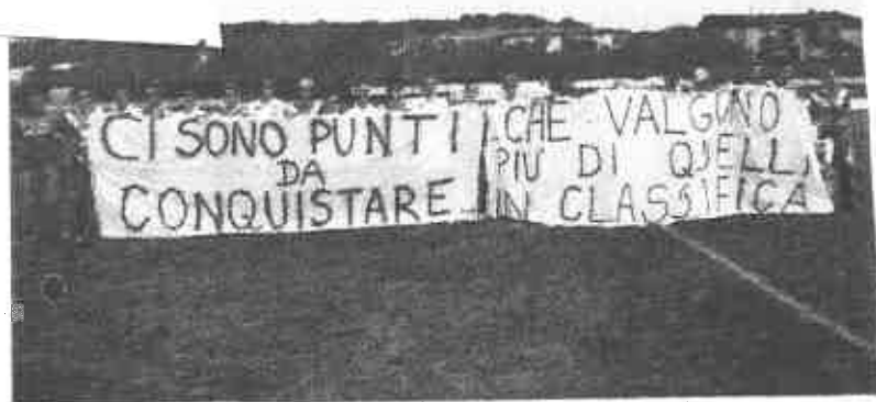
Protesta. Lo striscione esposto sabato prima del match di Supercoppa