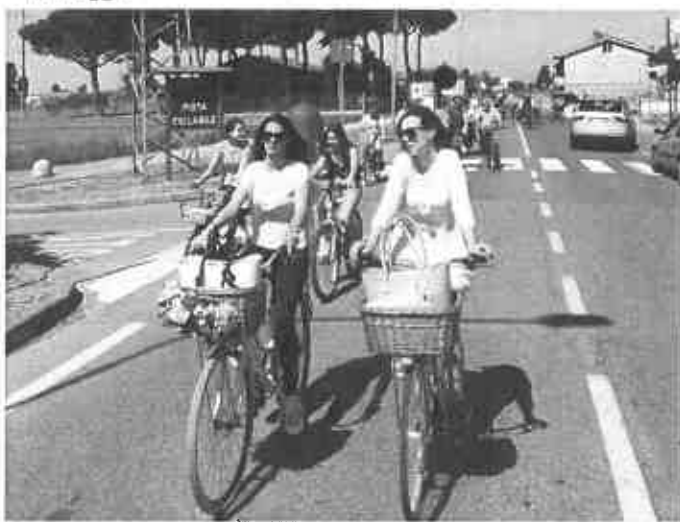
Bicincittà a Ponsacco

“Il nostro territorio possiede un patrimonio dimenticato di sentieri, strade bianche, vie secondarie che, opportunamente promosso, può diventare un bene prezioso per creare una rete ciclopedonabile di collegamento tra comuni limitrofi e tra centri urbani e periferie.