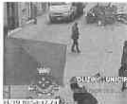
Il vigile trascinato dal furgone in Corso Italia