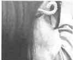
La pasionaria Livornese: 'Bello Salvini'