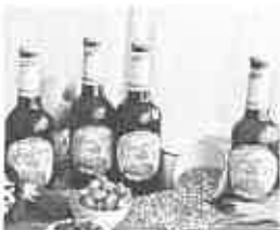
La birra diventa local per l'Expo 2015