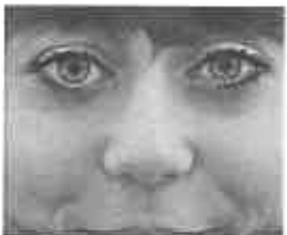
Le 5 buoni abitudini da adottare per imparare le lingue con facilità