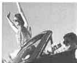
Con Genertel Risparmi fino al 50% sulla tua RCA. Scopri come