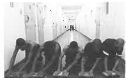
"The Good Media": in storie del mondo raccontate dai fotografi più prestigiosi