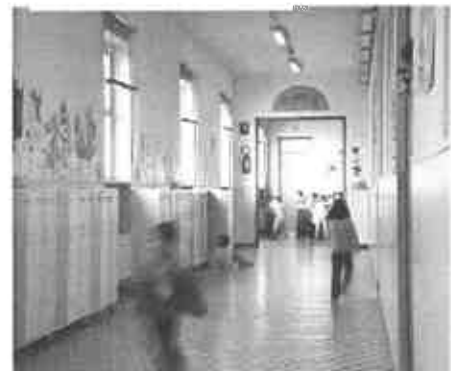
Scuola, Faraone: domani in piazza ci sarà una minoranza del paese

Una diminuzione che conferma i trend degli anni passati. "La riduzione annua di circa il 5,5 per cento (dei contributi che in base alla legge 286 arrivano dalle fondazioni bancarie, ndr) registrata sul totale dei proventi risulta, anche se di poco, più marcata rispetto a quella del 2012 - spiega il report - che registrava una percentuale in ribasso di 4,2 punti percentuali rispetto al 2011. Nel triennio 2011-2013 i proventi complessivi sono passati da 100 milioni di euro a 90,9 registrando una contrazione di circa il 9,4 per cento ". Una riduzione significativa rispetto al 2012, di un buon 14 per cento, c'è stata invece nelle nuove risorse attribuite dai Comitati di gestione dalle Fondazioni bancarie. L'accordo con l'Acri per il 2013 prevedeva 45 milioni di euro. Circa che, grazie probabilmente a residui di fondi speciali delle fondazioni, spiega il rapporto, è arrivata a 49,6. Nel 2012, invece, queste risorse ammontavano a circa 58 milioni. Calano anche gli oneri. La capacità di spesa scende complessivamente del 22 per cento circa, passando da 75 milioni a 58.