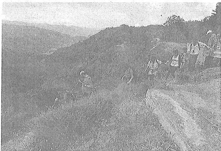
Escursionisti attraverso la Valle di Mezzo tra Cafarda e il fiume Melito nei territori di Pentone e Sorbo San Basile

Subito dopo la discesa a valle ha segnato il passaggio nella fascia dei castagni, la cui coltivazione cura e trattamento dei prodotti era un'antica attività economica predominante nell'intera zona presilana catanzarese. In questa zona gli escursionisti hanno potuto