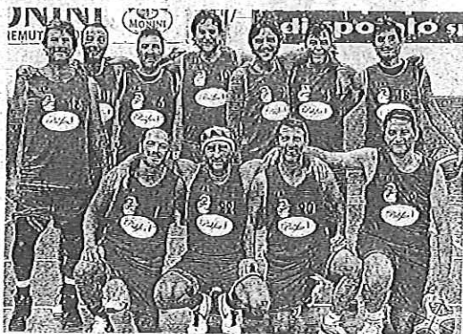
Il Cor Basket Roma, tutti over 40, che ha vinto a Spoleto il Memorial Selli