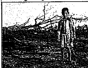
Scatti per cambiare il mondo: le foto di Shoot4Change