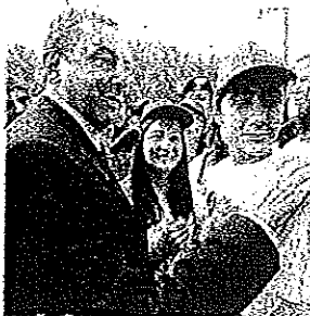
Il ministro Profumo

NAPOLI - Quattro milioni di euro sono stati stanziati dal Ministero dello Sport per la diffusione della pratica sportiva nelle scuole delle aree a rischio. E' questo l'accordo di programma sottoscritto ieri mattina dai ministri dello sport, Piero Gnudi, e dell'istruzione, Francesco Profumo, all'Istituto "Carlo Levi", a Napoli, nel quartiere di Scampia. Il contributo servirà ad ampliare i programmi di "Alfabetizzazione motoria" nella scuola primaria, proprio negli istituti che si trovano in aree periferiche e con alta presenza multietnica. Con un investimento di 2 milioni di euro verrà sostenuto il programma già avviato nel 2009 dal Miur e dal Coni e si coinvolgeranno altri 100mila studenti. Un milione di euro sono stati stanziati per un secondo progetto che riguarderà l'organizzazione delle finali nazionali dei Giochi Sportivi Studenteschi nelle