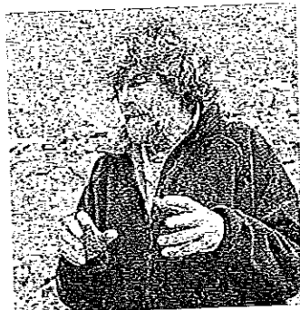
Reinhold Messner, 67 anni